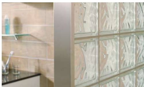
Afwerkingsprofiel 8x250 cm