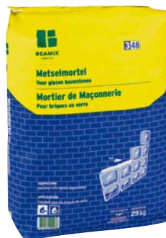
Metselmortel 25 kg