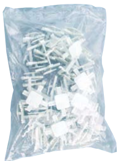
Glasklokkruisjes 8 cm