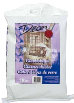
Glasklokljm 18 kg

Vochtwerend, voor zowel lijmen als voegen